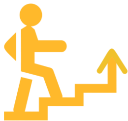
Логотип трека «Орлёнок – лидер»

Трек является завершающим в учебном году, подводящим итоги участия первоклассников в Программе. Основной задачей является оценка уровня сплочённости класса и приобретённых ребёнком знаний и опыта совместной деятельности в классе как коллективе.